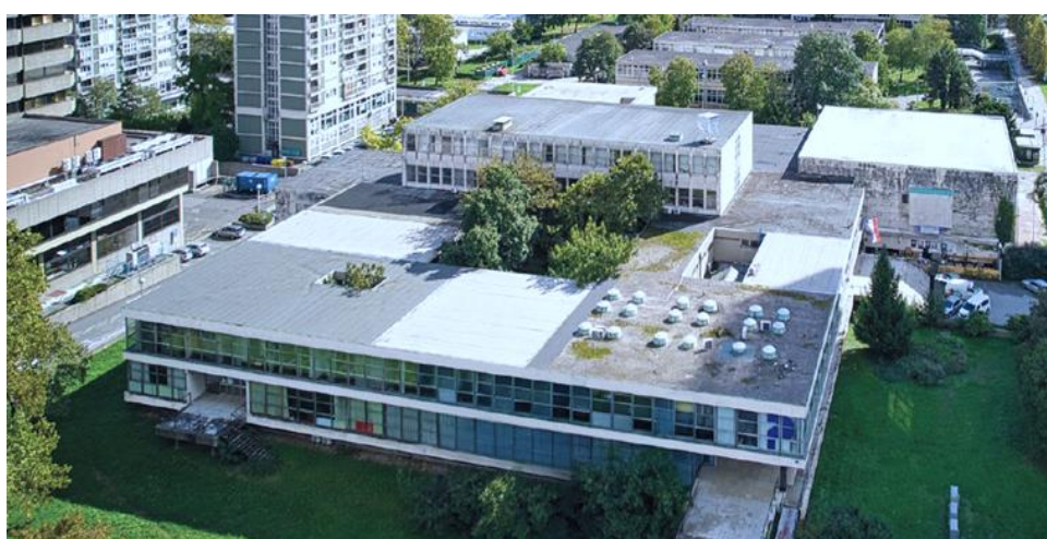
PUČKO OTVORENO UČILIŠTE ZAGREB